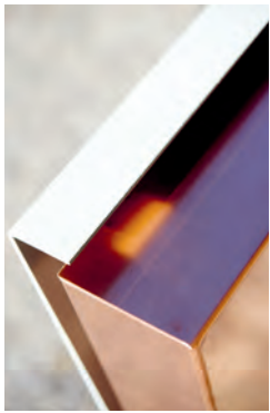
Im Kontrast zur makellosen Oberfläche des Alupanels wird das Kupfer allmählich eine Patina entwickeln.