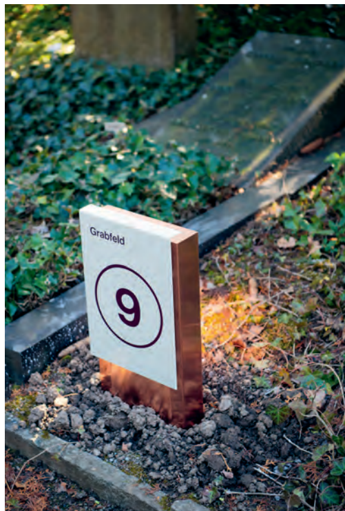
Auch dort, wo die Grabfelder nicht systematisch geordnet sind, soll das neue Signaletiksystem für mehr Orientierung sorgen.