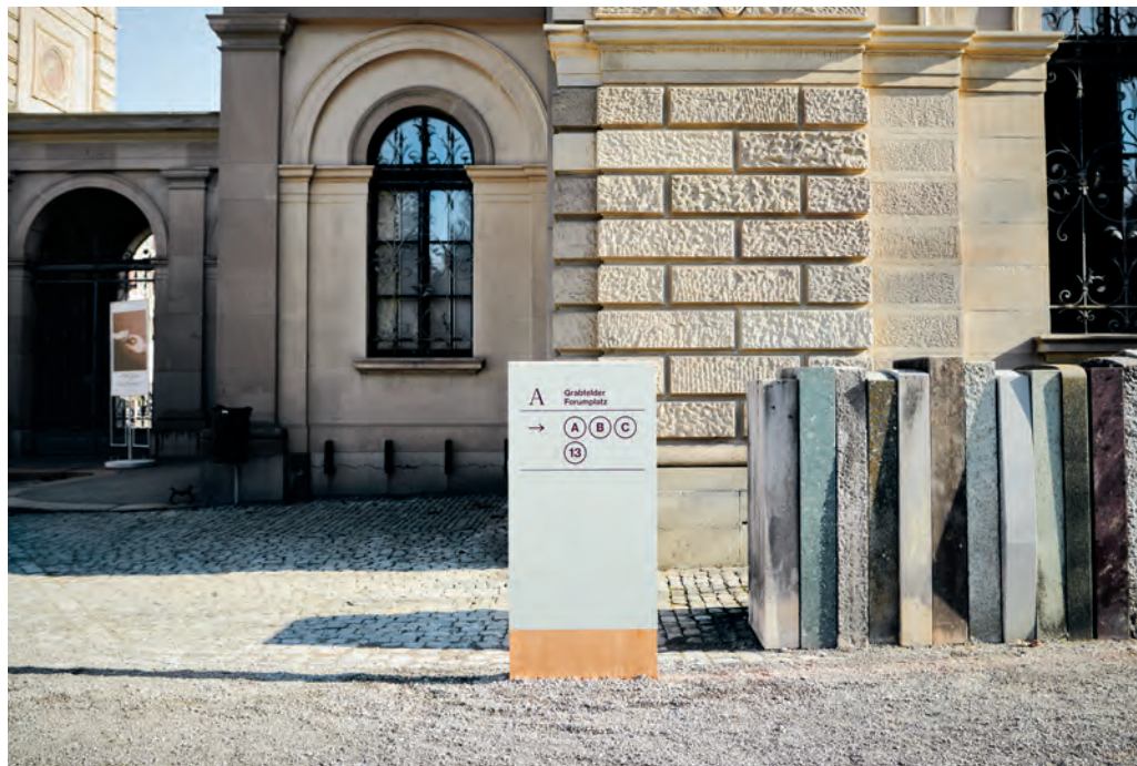
Mit dem Projekt «Erinnerungslandschaften» überzeugte das junge Designstudio M-D-Buero im Wettbewerb.

→ absteigenden Hausnummern orientieren. Das ist auf Friedhöfen nicht möglich. M-D-Buero schlug deshalb vor, Hauptwege ohne Namen zu definieren, die zu Plätzen führen. Von dort werden die Besucherinnen und Besucher weiter zu den Grabfeldern geleitet.