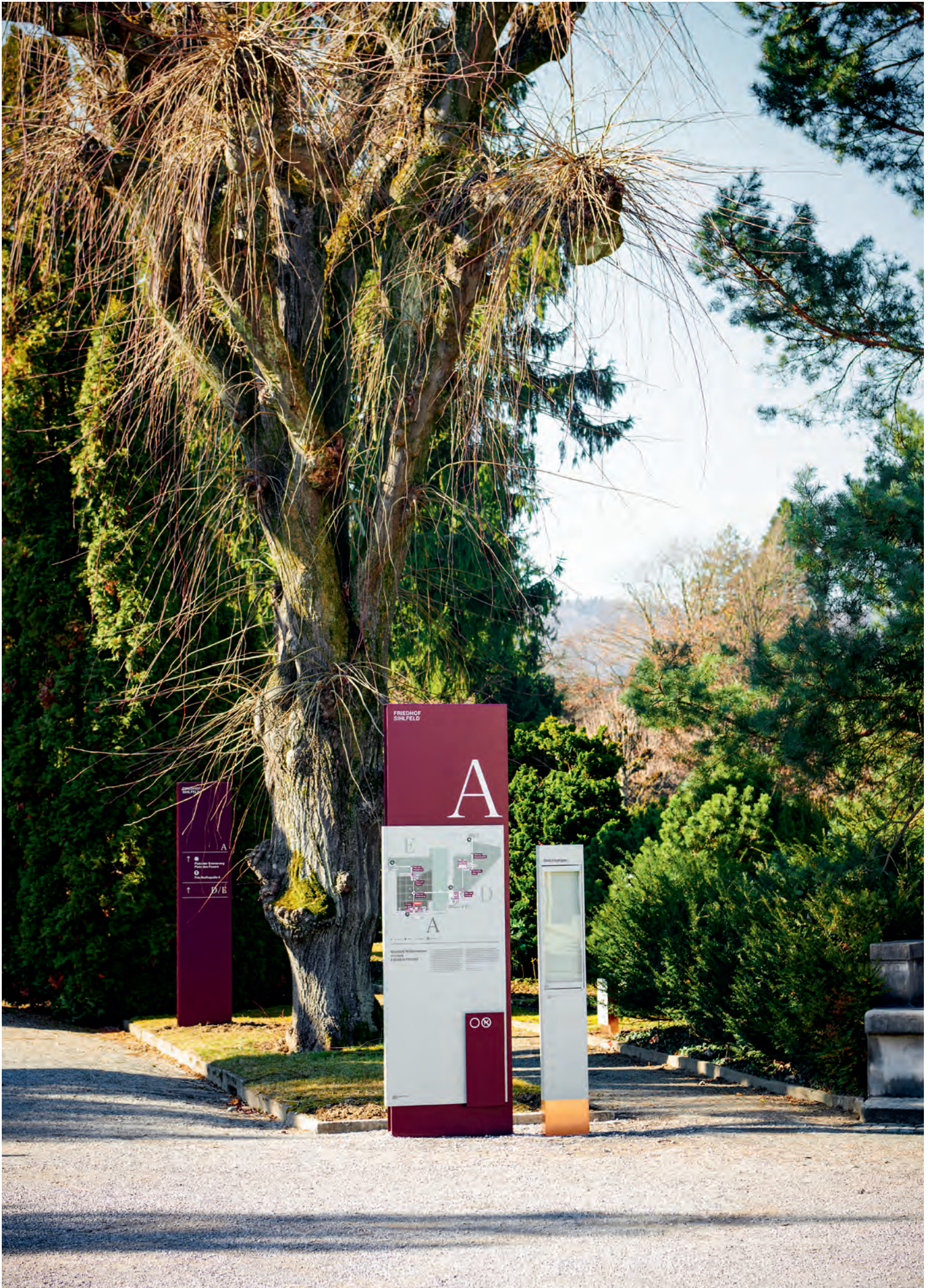
Derzeit läuft der Praxistext auf dem Friedhof Sihlfeld. Ab 2023 soll die Signaletik auf allen 19 städtischen Friedhöfen in Zürich zum Einsatz kommen.