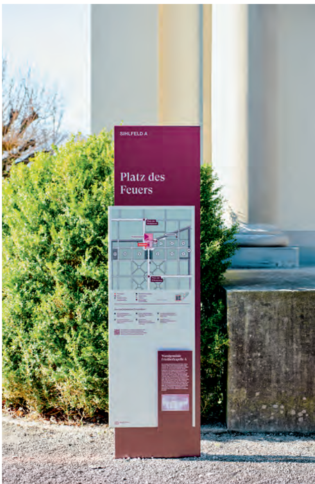
Weil die Wege keine Namen tragen und Grabfelder nicht logisch nummeriert sind, haben die Grafikerinnen neue Plätze definiert, die durch die Anlage leiten.

Antje Reineck, Artdirektorin Hochparterre